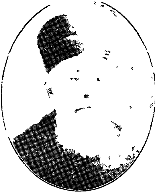
ऋषिकल्प दादाभाई नौरोजी